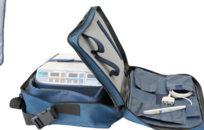
100-215 Torba do aparatu ES120

Pełen wybór akcesoriów znajdą Państwo w naszym katalogu. Więcej informacji u przedstawicieli regionalnych i na stronie www.emed.pl